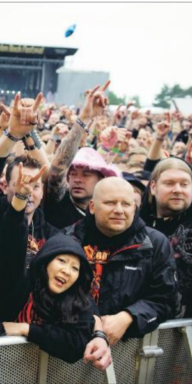
evangelisera och stötta människor i samtal.

Fotnot: Peace & Love hålls 28 juni till 2 juli. Två av årets dragplåster är Kings of Leon och Bob Dylan.